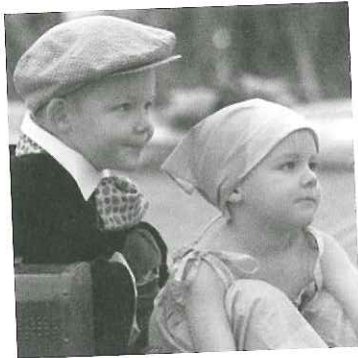
Figura 1. Imagen secreta

En esta sección vamos a aplicar las ideas anteriores a la imagen secreta que se muestra en la figura 1. Vamos a desarrollar concretamente un esquema (3, 2), por ejemplo.